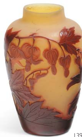
139 EMILE GALLÉ (1846-1904) - NANCY

Vasetto vetro incolore con inclusione di polvere vitrea gialla, doppiato in vetro rosso. Lavorazione all'acido e alla mola con decoro di foglie e bacche. Firma a cammeo. 1900 circa. Altezza cm 10 € 400 - 500