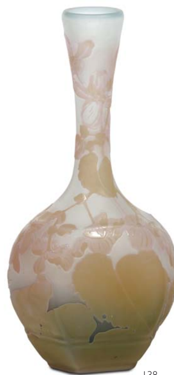
138 EMILE GALLÉ (1846-1904) - NANCY

Vaso in vetro incolore doppiato in vetro rosa, acidato e rifinito alla mola con decoro di fiori. 1900 circa, altezza cm 22 € 1.500 - 2.000