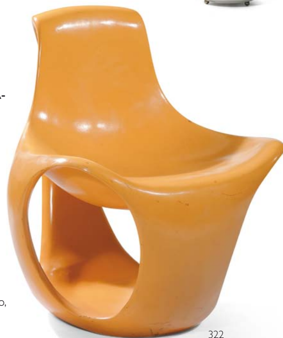
322 POLTRONA IN VETRORESINA COLOR ZAFFERANO, 1970 CIRCA € 1.300 - 1.500