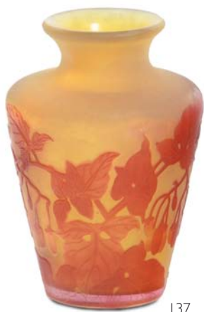
137 EMILE GALLÉ (1846-1904) - NANCY

Vaso solifleur vetro incolore con inclusione di polveri vitree azzurre e rosa. Lavorazione all'acido e alla mola con decoro floreale. Altezza cm 24. Firma a cammeo con stella, posteriore al 1904 € 1.200 - 1.500