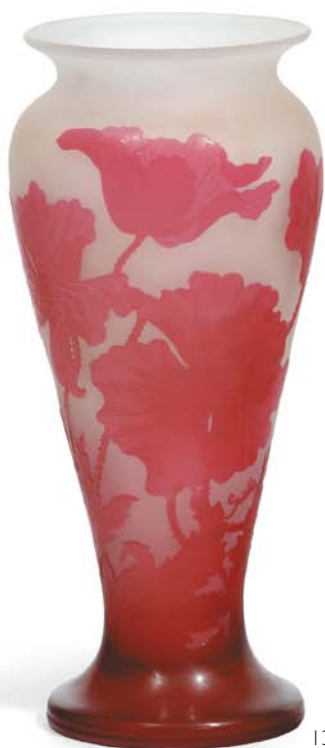
136 EMILE GALLÉ (1846-1904) - NANCY

Vaso in vetro incolore doppiato in vetro rosa, acidato e rifinito alla mola con decoro di fiori. 1900 circa, altezza cm 22 € 1.500 - 2.000