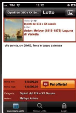
IMMAGINE LOTTO LOT IMAGE