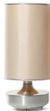
320 UMBERTO RIVA PER FONTANA ARTE GiGi Lampada da tavolo, 1989, cm 20x17 € 500 - 600