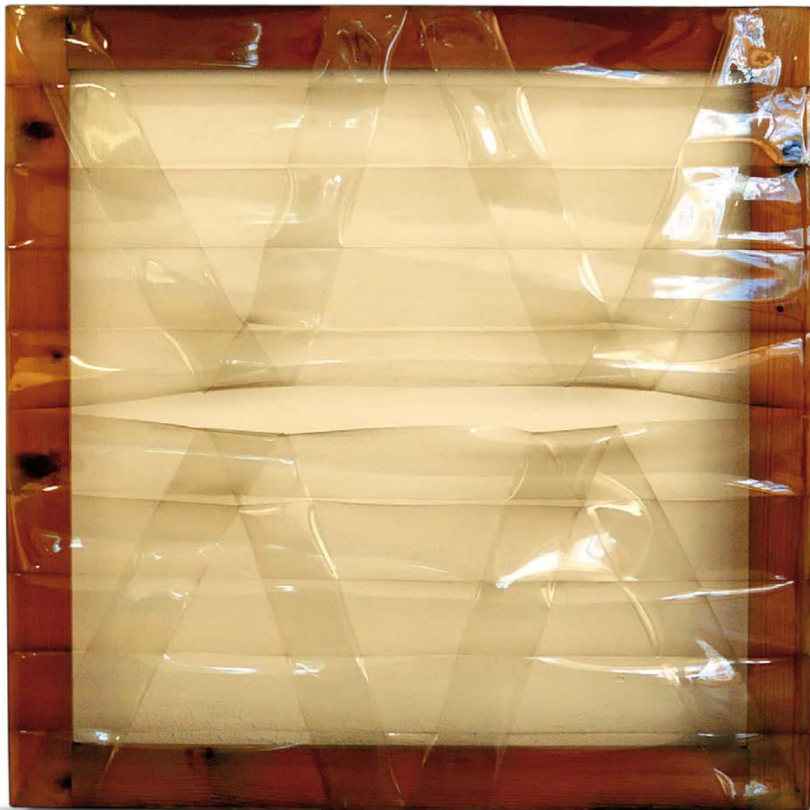
Carla Accardi, Trasparente , 1977, sicofoil su telaio in legno, 70 x 70 cm